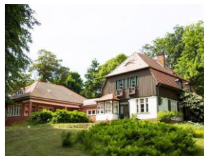
Gerhard Hauptmann Haus