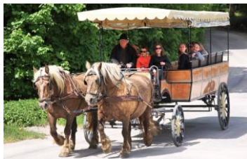
Kutschfahrt im Kremser

Besuchen Sie mit uns die Insel Hiddensee, „Dat sôte Länneken“, wie sie auch liebevoll genannt wird. Die rund 18 km 2 große Ostseeinsel hat etwa 1.100 Einwohner. Sie ist Rügen westlich vorgelagert und nur mit dem Schiff zu erreichen. Privater Autoverkehr ist auf Hiddensee nicht gestattet. Es gibt wenige Fahrzeuge mit Sondergenehmigung. Die Insel hat eine unverwechselbare vielfältige Landschaft: Strände, Steilufer, weite Wiesenflächen, verschilfte Boddenufer und eine besondere Heidelandschaft. Auf der höchsten Erhebung, dem Dornbusch, befindet sich der Leuchtturm. Schon Gerhard Hauptmann, Albert Einstein, Asta Nielsen u.v.a. suchten hier fern ab vom Alltag Inspiration und Entspannung. Wir bringen Sie mit dem Bus nach Schaprode, weiter geht es dann mit der Fähre nach Kloster. Hier beginnt unsere Inselrundfahrt mit dem Kremser. Wir zeigen Ihnen die Grabstätte Gerhard Hauptmanns, das Hauptmann-Haus, das Inselmuseum sowie den Strand. Danach freie Verfügung bis zur Rückfahrt nach Kloster, mit Schiff zurück nach Schaprode und von dort mit dem Bus zum Hotel.